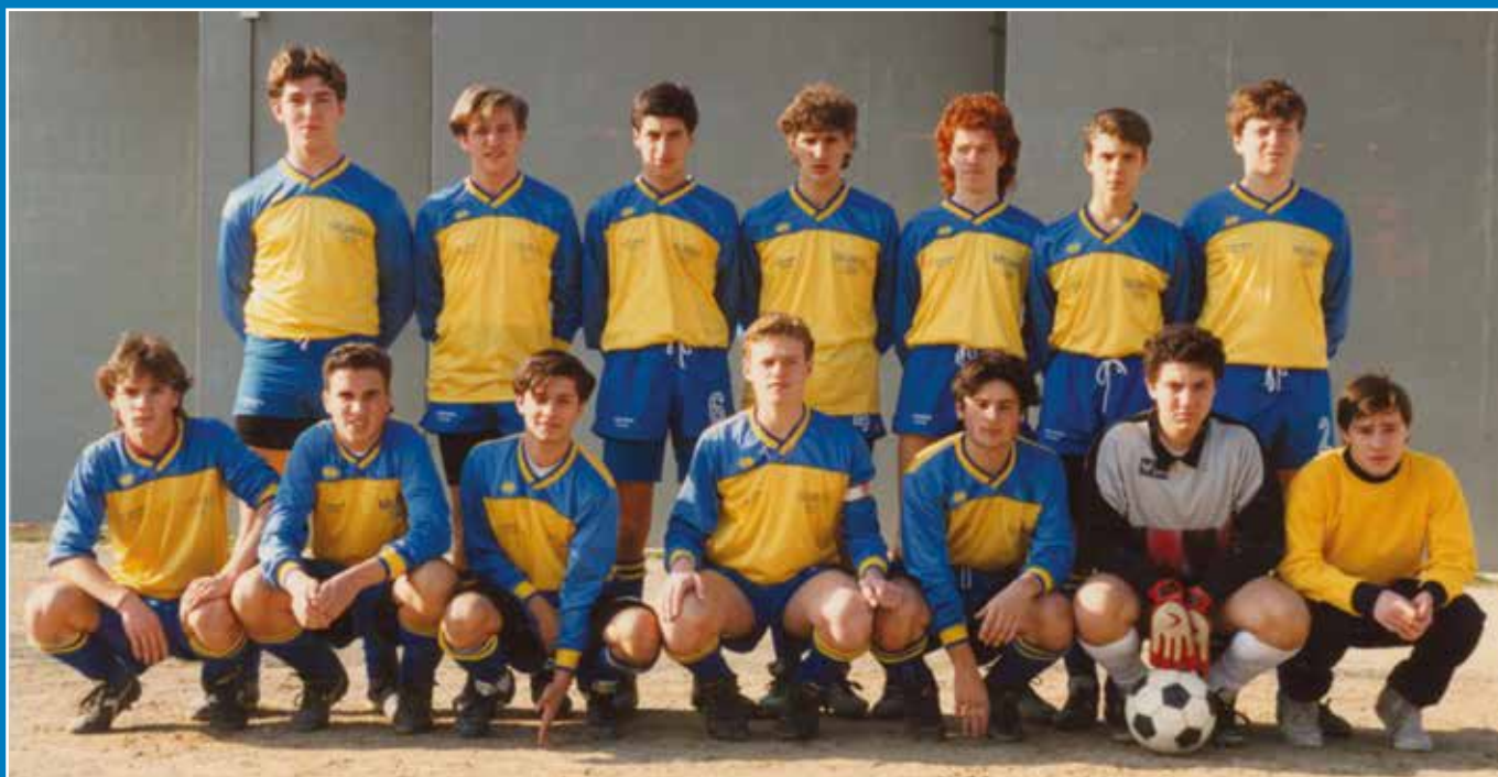
Sopra: una delle migliori formazioni dell'Azzurra RdR Campionato Allievi Provinciale FIGC.