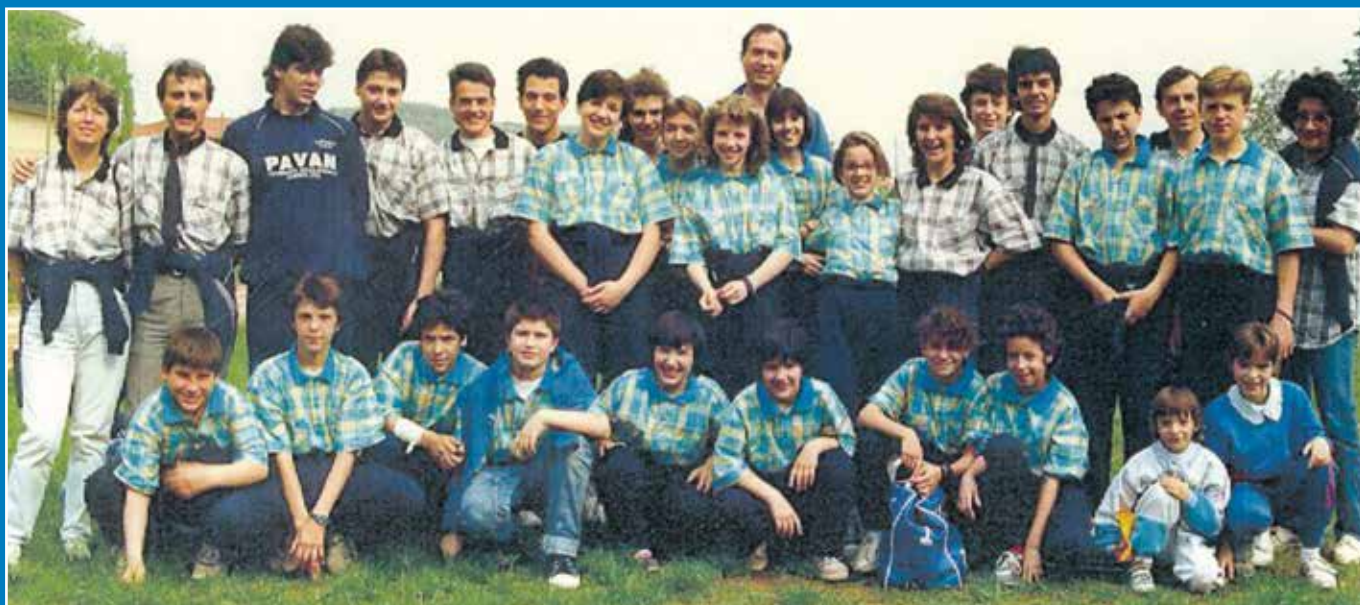
Una rappresentanza RdR delle varie sezioni partecipante ad un meeting polisportivo regionale organizzato dal Centro Sportivo Italia FVG.