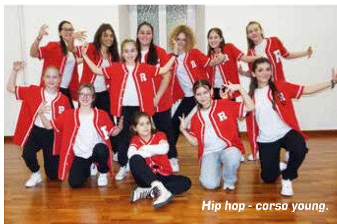
Hip hop - corso young.