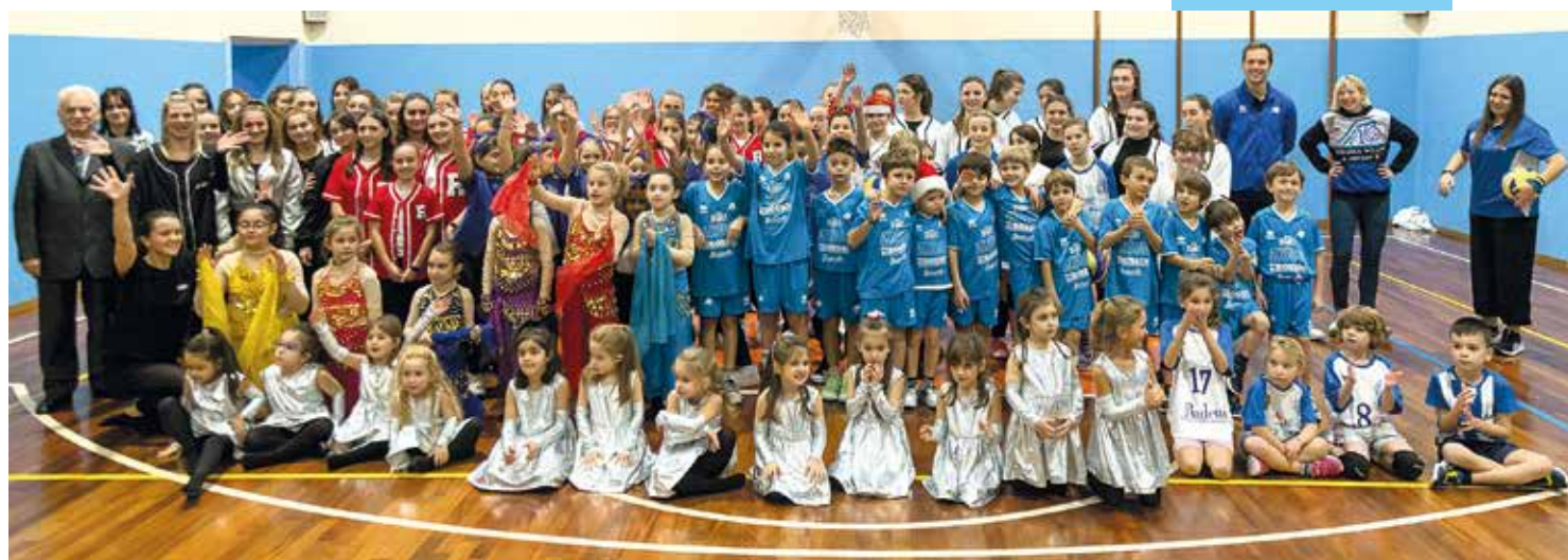
Natale sotto l'albero.

Passano pochi giorni e già si sente aria di carnevale; in sala giochi compaiono i primi