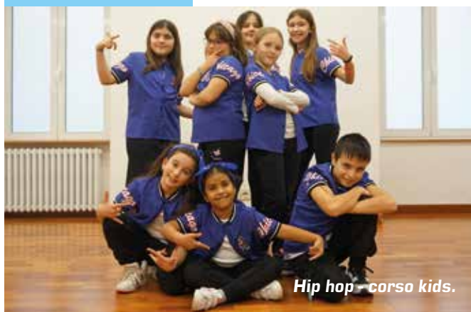
Hip hop - corso kids.