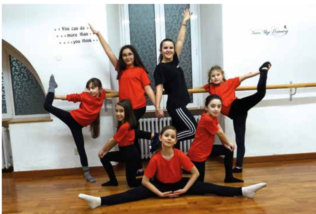
Danza moderna corso young.