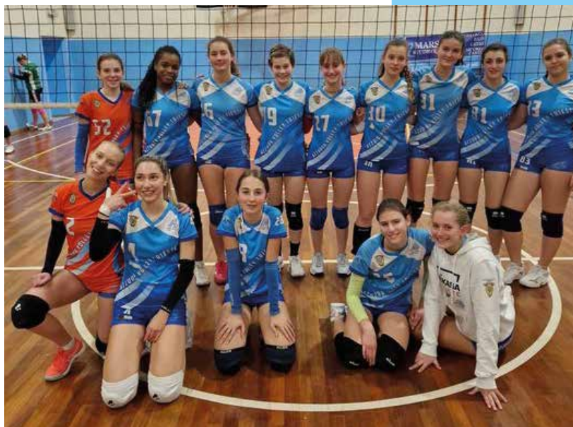
Terza Divisione e Under 16.