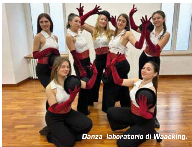
Danza laboratorio di Waacking.