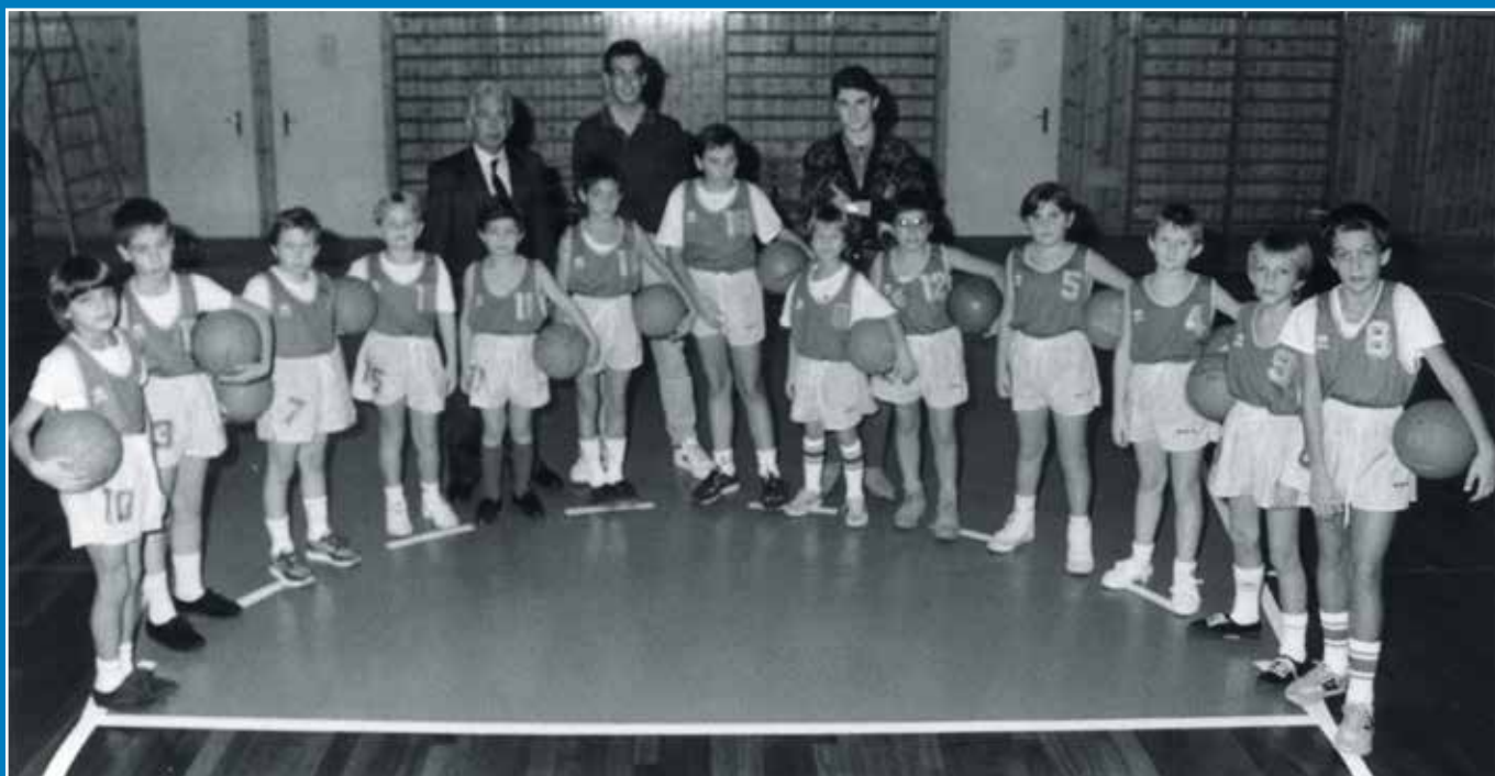
Sopra: primi inizi di Azzurra RdR minibasket.