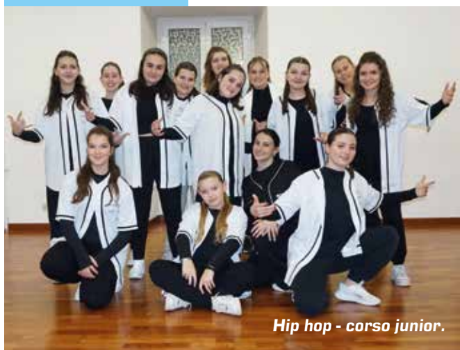
Hip hop - corso junior.