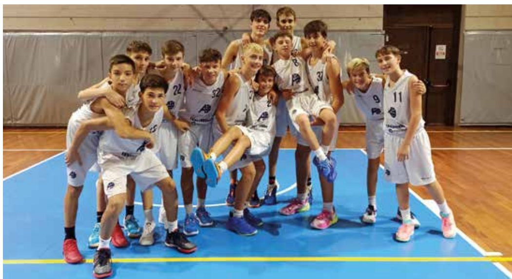
Varese, Memorial Bruno Arena, Torneo di Minibasket.