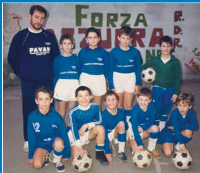
Una formazione partecipante al campionato FIGC provinciale.

Ricordiamo questa data, questa tappa, non un traguardo , pubblicando alcune foto delle pioniere e pionieri di questa grande storia ed avventura.