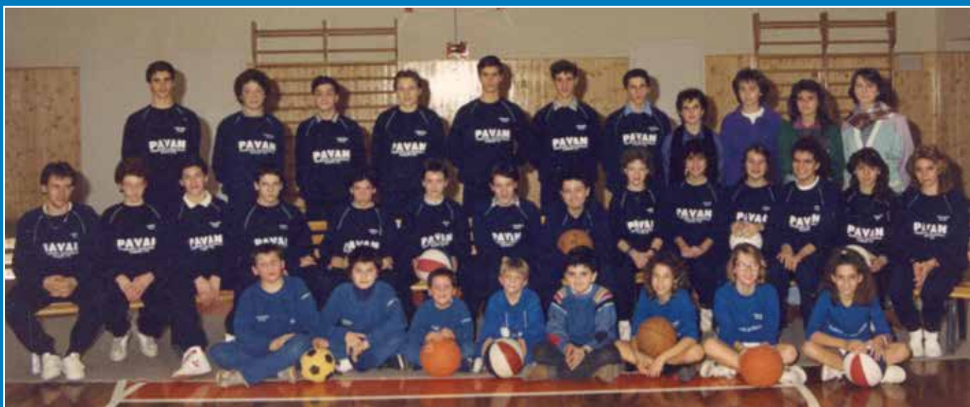
Sotto: Gruppo misto di varie sezioni di calcio, pallavolo e minibasket.