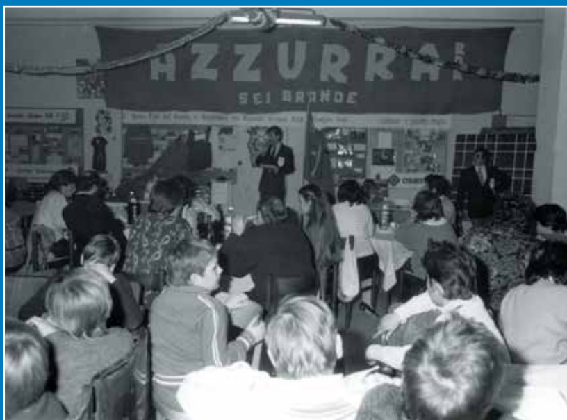
A sinistra: serata Azzurra RdR in sede per la festa di don Bosco con la partecipazione di atleti e atlete.