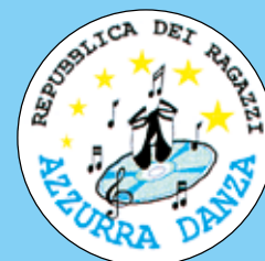
Danza moderna - corso baby.

Il sole illumina la sala, le finestre sono aperte, si respira quella tipica atmosfera primaverile che anticipa l'evento più atteso dell'anno, il saggio finale.